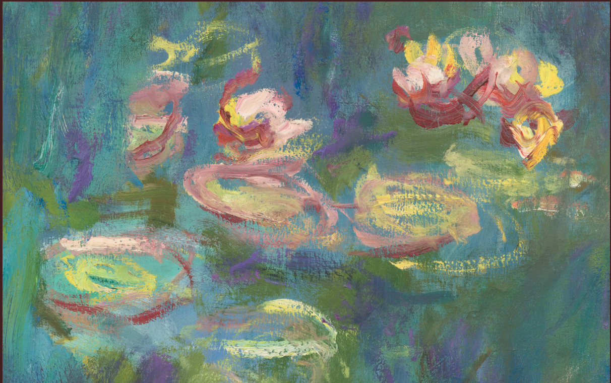
CLAUDE MONET LES NYMPHÉAS : REFLETS VERTS (DÉTAIL), ENTRE 1914 ET 1926 HUILE SUR TOILE MAROUFLÉE SUR LE MUR, H. 200 ; L. 850 cm COLLECTION MUSÉE DE L'ORANGERIE